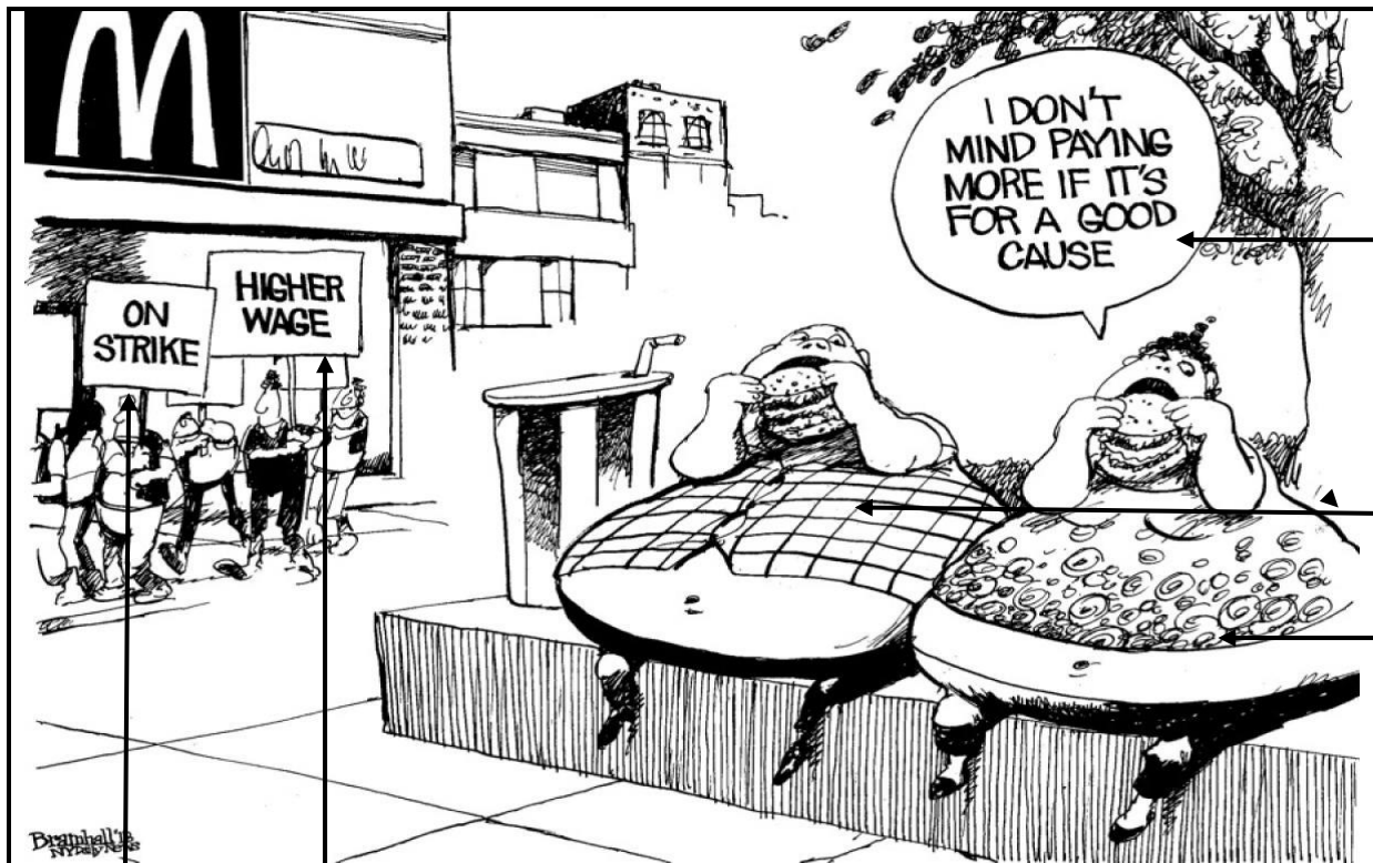
[Uit http://www.nydailynews.com/opinion/bramhall-cartoons-august-2d3-gallery- Toegang verkry op 15 November 2016.]

Die spotprent toon werknemers (links) by McDonald's wat staak vir hoër lone, en oorgewig klante (regs). M Lester het op 31 Augustus 2013 die spotprent met die titel 'McDonald's Health Care' vir die New York Daily News geteken.