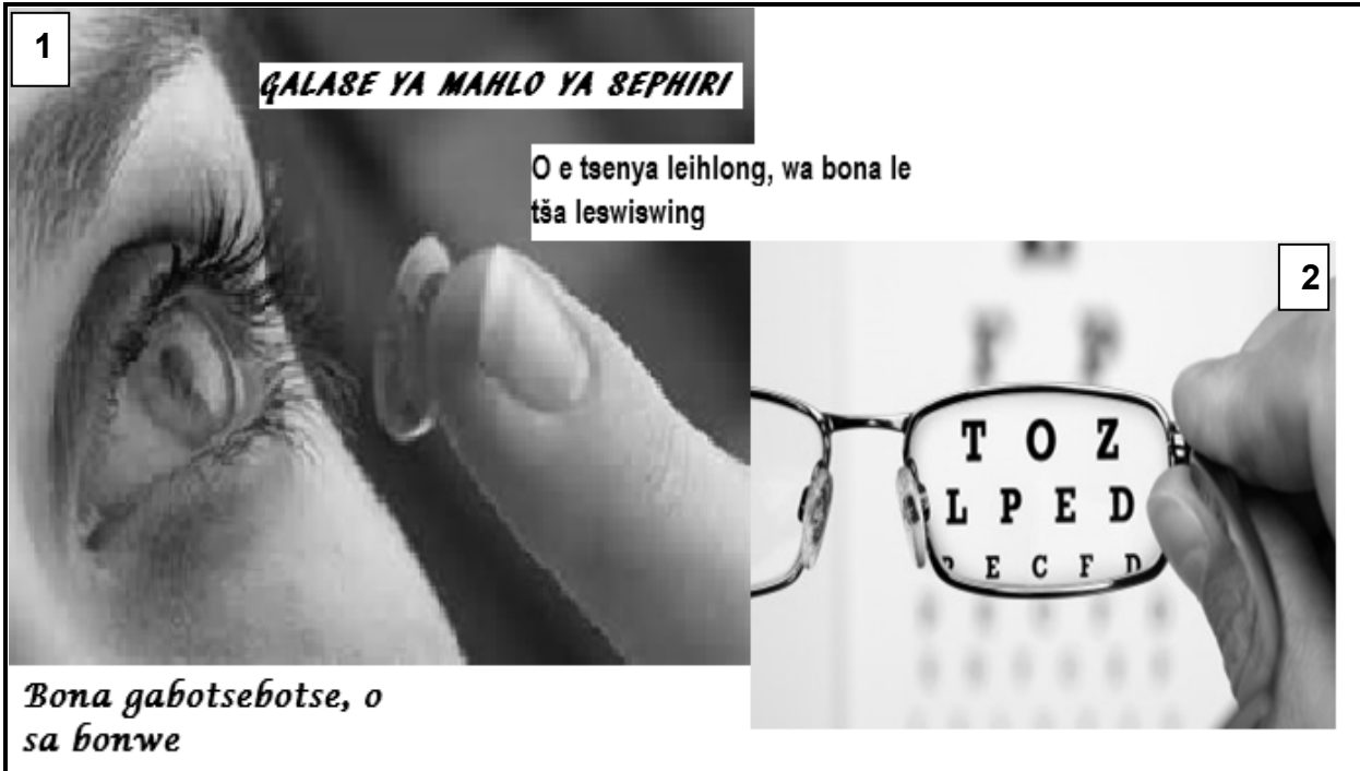
[ E amantšwe go tšwa go inthanete]