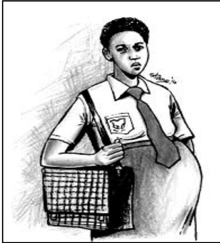
[Se nopotswe go tswa mo inthaneteng]

Morutwana mongwe wa marematlou o imile. Se ke kgwetlho e tona mo go mogokgo le barutabana ka ntlha ya go sa dire sentle mo dithutong tsa gagwe. Motsadi o bileditswe kwa sekolong go tla go utlwa ka ga seemo se. Kwala mmuisano magareng ga mogokgo le motsadi wa ngwana ka ga seemo se.