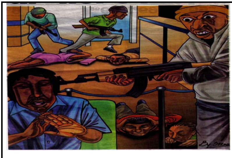
[E qotsitswe lesedinyaneng la Daily Sun la 14 Phato 2006]

Hlahlobisisa setshwantsho se ka hodimo ebe o etsa qeto hore se bolela eng. Ha o se o fihletse qeto eo, ngola moqoqo oo ka wona o bolelang seo setshwantsho se se hlahosang. Neha moqoqo wa hao sehlooho. [50]