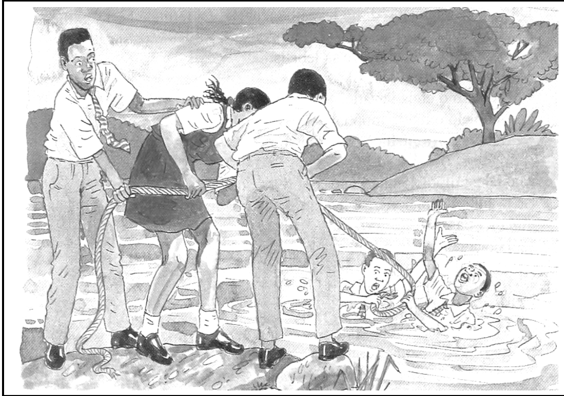
[Setshwantsho se qotsitse bukeng ya Sesotho sa Nnete , Kereite ya 9; Phuroe le ba bang; 2006: 52]