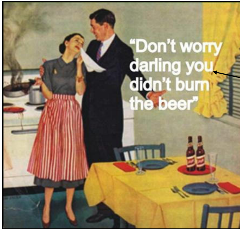
FIGUUR C: Schlitz-bieradvertensie, ontwerper onbekend (Amerika), 1950's.

Bespreek die gebruik van geslagstereotipering en vooroordeel in die plakkaat in FIGUUR C hierbo.