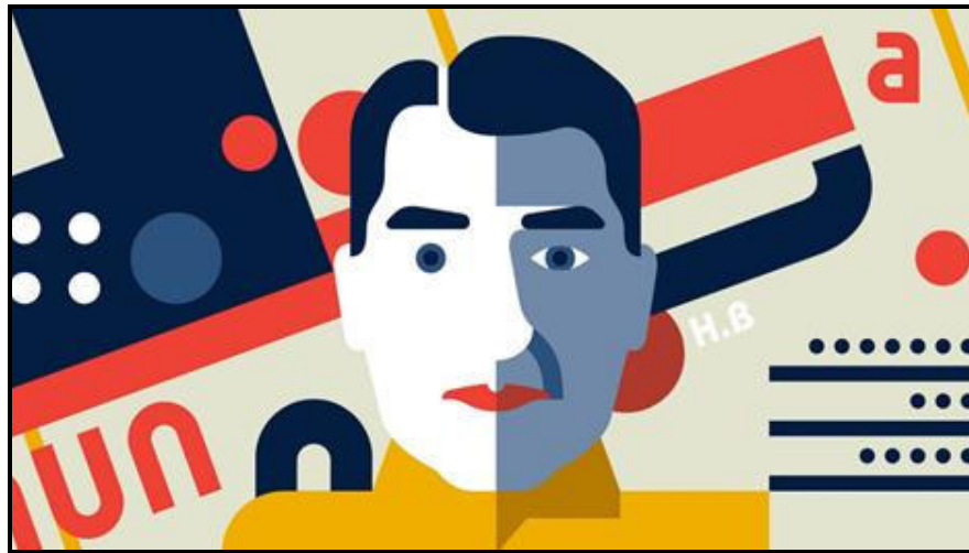
FIGUUR I: Bauhaus-styl-illustrasie deur Vesa Sammallahti vir Dezeen aanlyn tydskrif (Denemarke), 2018.

Skryf 'n opstel (ten minste EEN bladsy) waarin jy die illustrasies in FIGUUR H en FIGUUR I hierbo vergelyk. Verduidelik hoekom hulle tipies is van die ontwerpbewegings wat hulle verteenwoordig.