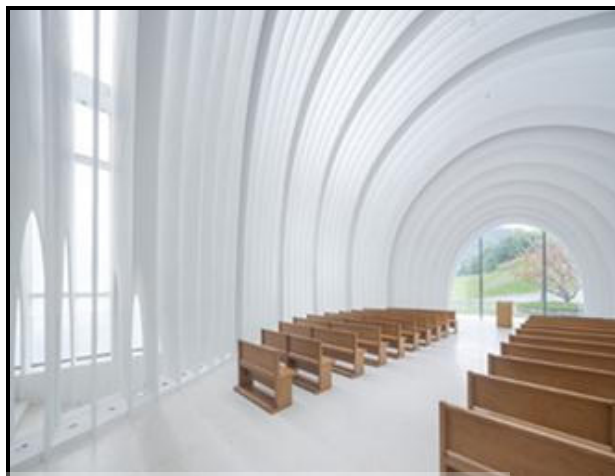
FIGUUR G: Chamber Church deur Büro Ziyu Zhuang (China), 2022.