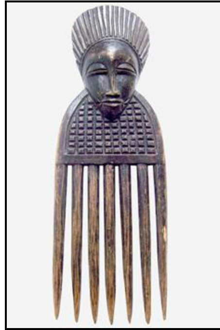
FIGUUR E: Die Afrika-houtkam , ontwerper onbekend (Kongo), ongedateer.

Skryf 'n paragraaf deur die haarkamme in FIGUUR D en FIGUUR E te vergelyk met verwysing na die volgende: