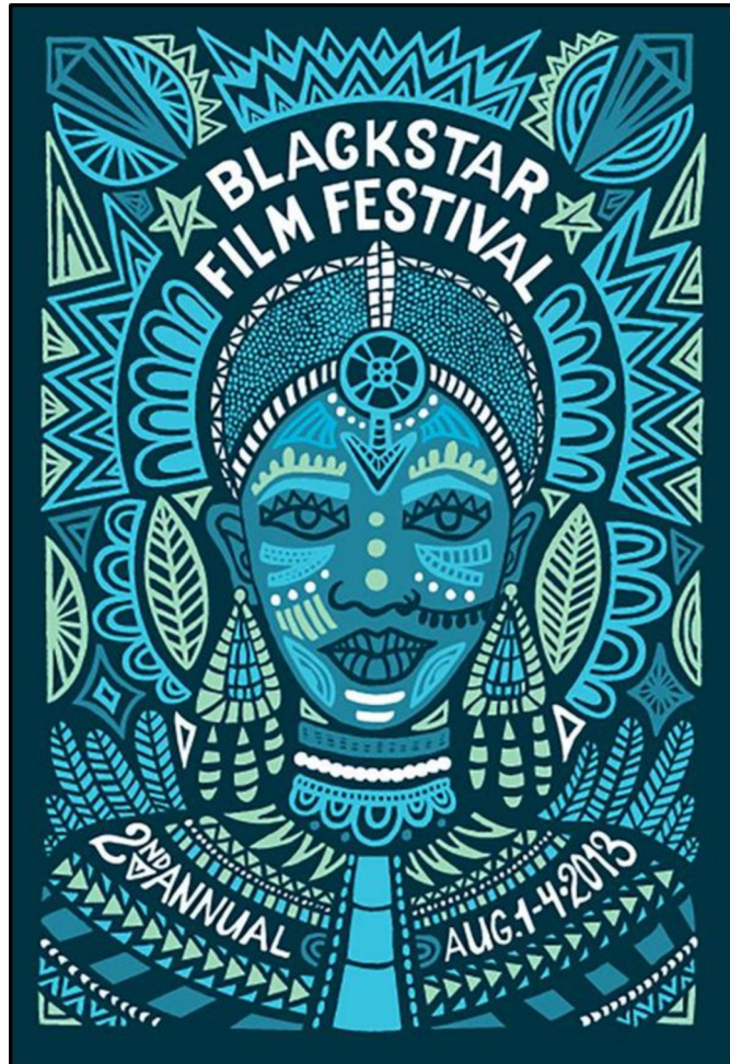
FIGUUR A: Black Star-filmfeesplakkaat ontwerp deur Andrea Pippins (VSA), 2016.

1.1.1 Analiseer die gebruik van die volgende elemente en beginsels in FIGUUR A hierbo: