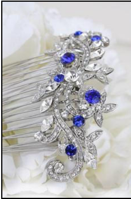
FIGUUR D: Saffier-bloukristal-bruidshaarkam deur Swarovski (Oekraïne), 2009.