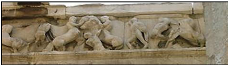
FIGUUR F: Tempel van Hephaestus deur Ictinus (Griekeland), 450 VHJ.