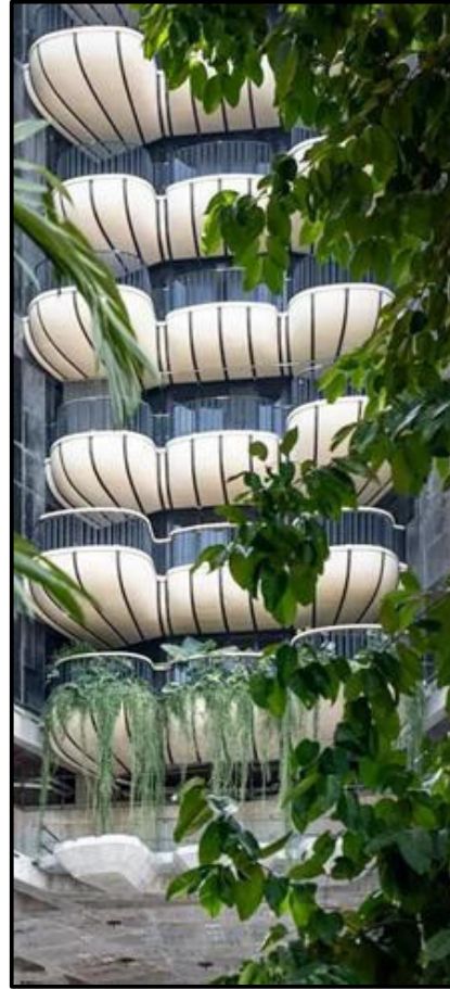
FIGUUR K: Ultraluukse toringgebou-hotel in Singapoer met organiese, kroonblaarvormige balkonne deur Heatherwick Studio (Londen), 2021.