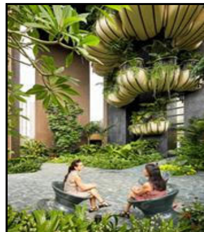
Binne- en buiteansigte

Die interieur en eksterieur van die gebou se ontwerp in FIGUUR K werk na 'n 'groener visie' vir die toekoms wat tot voordeel van die mensdom is.