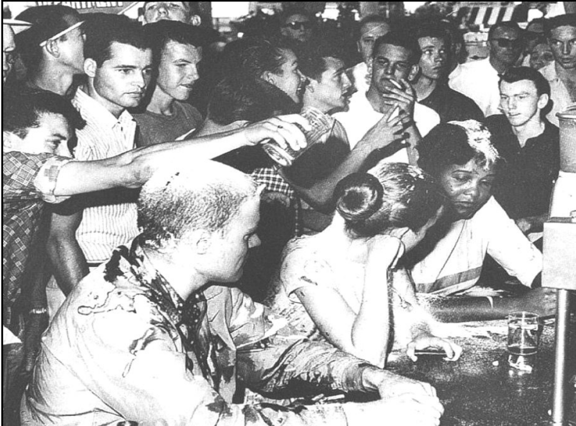
[Uit Parting the Waters: America in the King Years 1954–63 deur T Branch]

Die bron hieronder is 'n foto uit 'n boek met die titel Parting the Waters: America in the King Years 1954–63 deur T Branch. Dit toon drie studente wat op 28 Mei 1963 aan 'n sitstaking by 'n middagete-toonbank in Jackson, Mississippi, deelneem. 'n Lid van die wit groep gooi 'n vloeistof oor 'n sittende student uit.