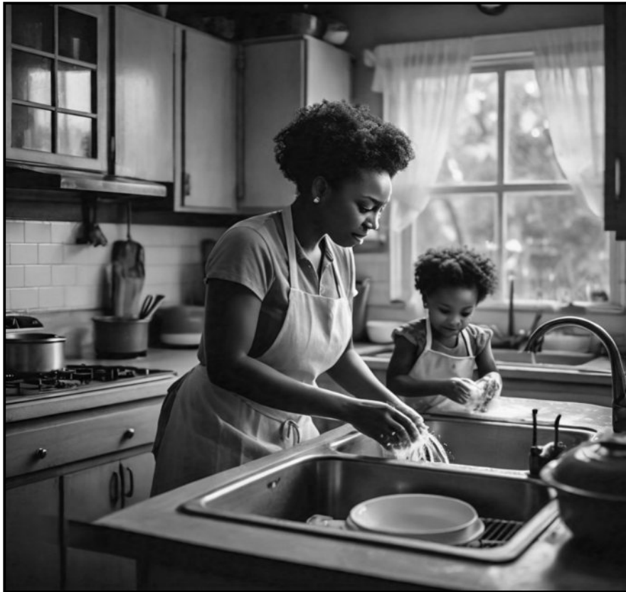
[Mothopo: Meta AI]