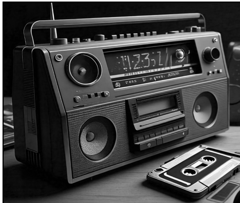
[Mothopo: Meta AI]