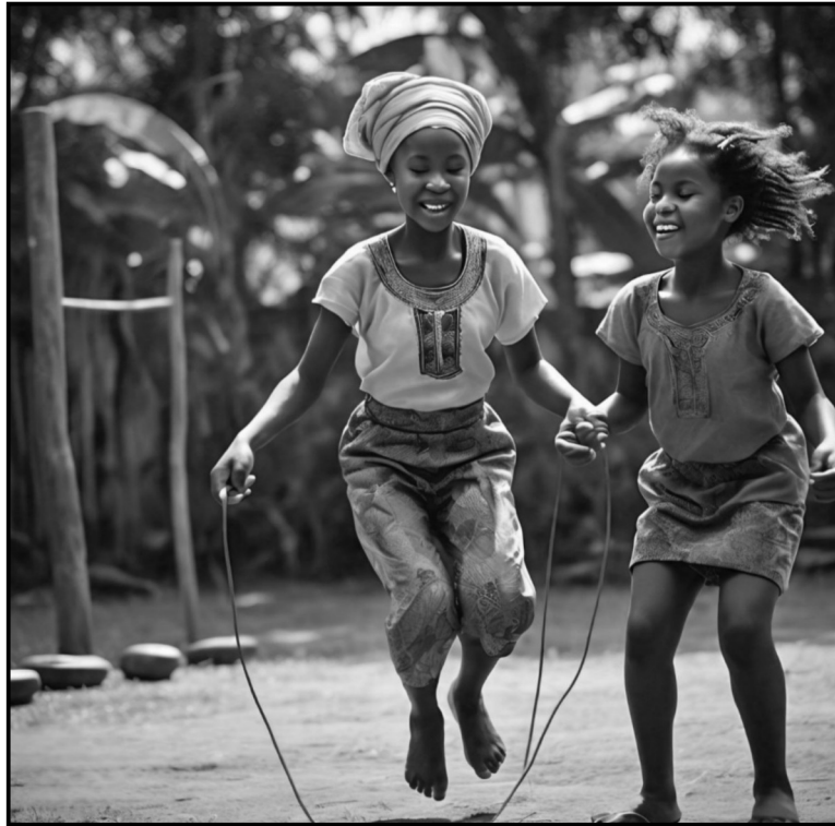
[Mothopo: Meta A]